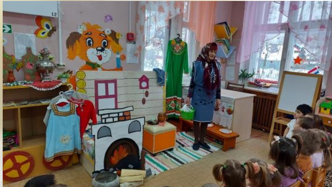
На средней группе