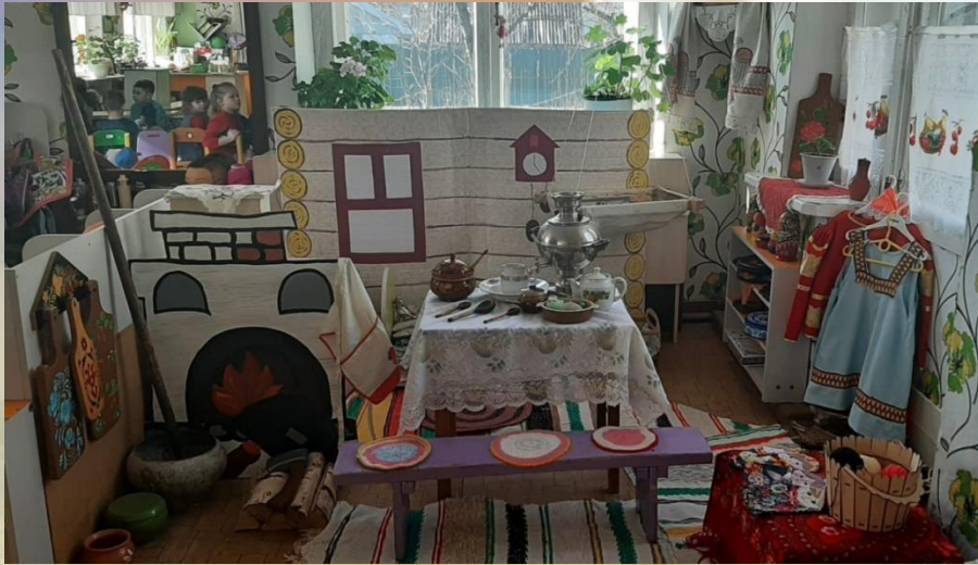
На младшей группе