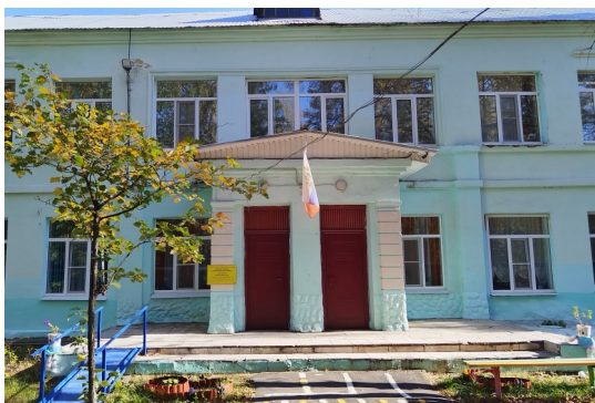
МБДОУ «Детский сад №40 комбинированного вида»

Адрес: Проспект 50 лет Советской Власти д.17 . Проезд автобусами 1,2,124 до остановки «Дзержинский завод».