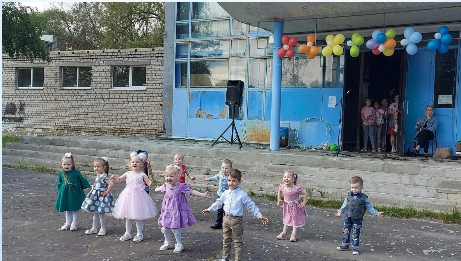
Танец «Детки – конфетки»